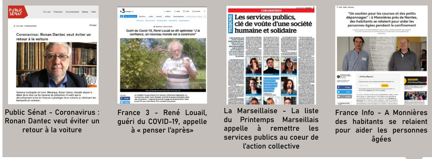
Public Sénat - Coronavirus : Ronan Dantec veut éviter un retour à la voiture

Les membres du réseau Ensemble sur nos Territoires prennent la parole, mènent des actions quotidiennes et font avancer les solidarités et l'écologie dans nos territoires !